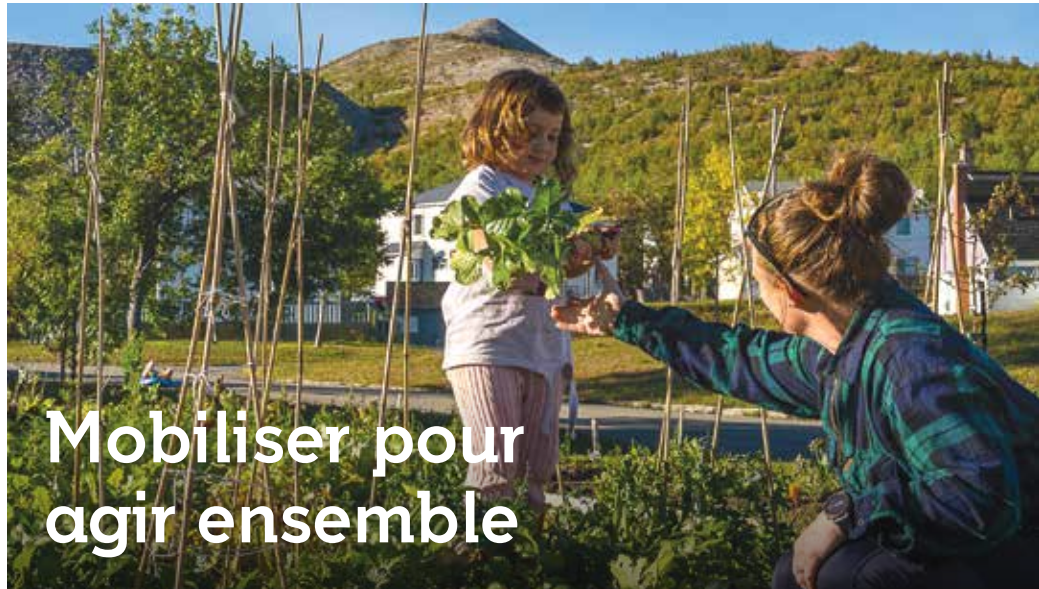
Potager en famille à Murdochville.

La démarche intégrée en développement social soulignera le 12 octobre prochain son 5 e anniversaire! Depuis 2017, une soixantaine de partenaires portent un plan de communauté concerté qui rallie les besoins de la communauté 0-100 ans. Les actions sont priorisées et déployées principalement par les partenaires de cinq comités thématiques : Alimentation, Habitation, Aînés, Famille-Jeunesse et Emploi-Formation, ainsi que deux comités locaux : Estran et Murdochville. Depuis 2017, c'est plus d'une quarantaine de projets qui ont été soutenus, soit financièrement, ou par de l'accompagnement terrain, administratif ou logistique.