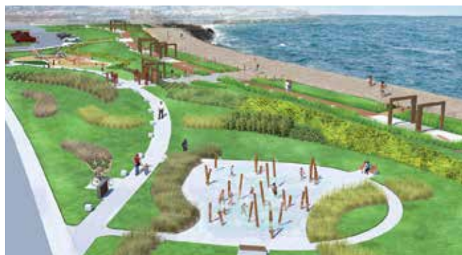
Esquisse du projet Capitale des pêches.

En plus de développer sa première politique familles et aînés, la MRC coordonne la mise à jour des politiques familles et aînés des municipalités de Grande-Vallée, Petite-Vallée, Cloridorme et Murdochville. Plus de 275 citoyens et citoyennes ont pris part aux différentes consultations, en plus des 50 organisations impliquées. Un support aux milieux qui permet d'avoir une vision d'ensemble des besoins des familles et des personnes aînées de La Côte-de-Gaspé et d'améliorer leur qualité de vie au quotidien.