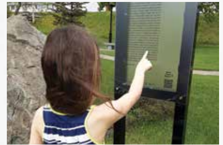
Installation littéraire de Murdochville.

Le Parcours littéraire de La Côte-de-Gaspé vise à faire rayonner les auteurs et les autrices d'ici ainsi que leurs œuvres. Réparties dans les cinq municipalités de la MRC, les installations du Parcours mettent en valeur un texte spécialement choisi pour le projet. Le code QR sur les installations permet d'entendre la version audio des écrits. Découvrez nos écrivains, leurs créations, et la grandeur de nos paysages ! Le Parcours littéraire est accessible en saison estivale et automnale.