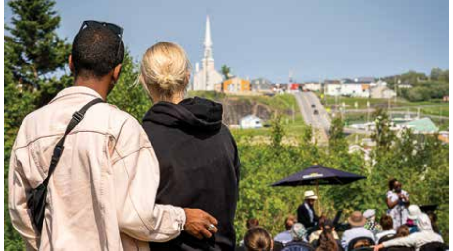
Spectacle en plein air à Grande-Vallée.

Comme bien d'autres MRC, La Côte-de-Gaspé fait face à d'importants enjeux démographiques. On observe, entre autres, l'arrivée de nouvelles familles de tous horizons, ainsi que le recours de plus en plus fréquent à la main-d'œuvre immigrante dans plusieurs entreprises. Cette nouvelle tendance nous a poussés à aller plus loin, en travaillant avec les organisations déjà en place, pour nous assurer d'accueillir les personnes immigrantes, de favoriser leur établissement durable et de leur proposer un milieu de vie adéquat et inclusif.