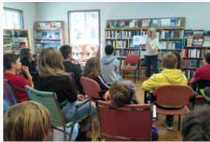
Atelier à Cloridorme.