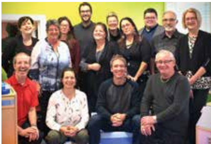
Comité local Estran.

La démarche intégrée en développement social soulignera le 12 octobre prochain son 5 e anniversaire! Depuis 2017, une soixantaine de partenaires portent un plan de communauté concerté qui rallie les besoins de la communauté 0-100 ans. Les actions sont priorisées et déployées principalement par les partenaires de cinq comités thématiques : Alimentation, Habitation, Aînés, Famille-Jeunesse et Emploi-Formation, ainsi que deux comités locaux : Estran et Murdochville. Depuis 2017, c'est plus d'une quarantaine de projets qui ont été soutenus, soit financièrement, ou par de l'accompagnement terrain, administratif ou logistique.