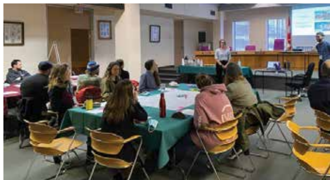
Atelier de travail à Murdochville.

Forte d'une volonté de voir son centre-ville mieux refléter la vitalité retrouvée de son milieu, la Ville de Murdochville a entamé une démarche de dynamisation de son centre-ville avec l'équipe de Rues principales. Cette organisation œuvre au dynamisme des cœurs des collectivités à travers le Québec depuis 1984. La MRC agit à titre d'accompagnatrice dans ce projet. Elle s'assure de la mobilisation de la communauté, participe à la collecte de données et coordonne les rencontres des divers comités. Le plan de dynamisation du centre-ville sera dévoilé cet automne et mènera à la réalisation de plusieurs chantiers qui en feront un milieu de vie rassembleur, prospère et attractif.