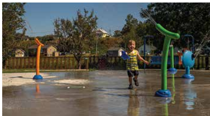
Jeux d'eau à Grande-Vallée.